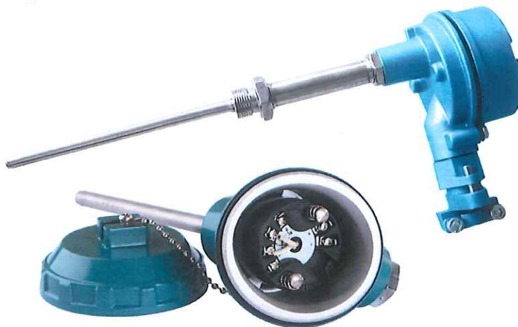
Рисунок 1 – Преобразователи температуры Метран-280, Метран-280-Ех